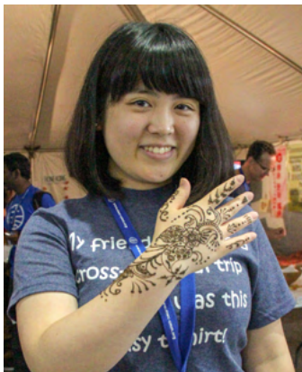
Sich ein Henna-Tattoo machen lassen im Global Church Village Asien Stand, 2015.