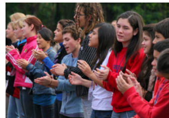
Spezielle Programme für Kinder, Teens und Jugendliche.

Die Jungen stehen in allen Teilen der Versammlung im Fokus. Biblische Botschaften entdecken, inspirierende Musik, Redner:innen der YABs, Sport- und Einsatzmöglichkeiten – es wird jede Menge Spass geben!