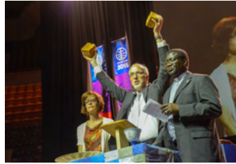
Internationale Redner:innen.

Werde für fünf Tage teil einer multikulturellen Gottesdiensterfahrung mit einem internationalen Chor und Band, internationalen Redner:innen und einer wirklich weltweiten Gemeinschaft Melde dich für den internationalen Chor an: mwc-cmm.org/choi