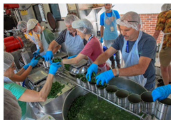
Diverse Einsatzmöglichkeiten.

Jeder Nachmittag bietet die Gelegenheit, zu lernen, teilen, Freunde kennenlernen. Große Auswahl an Touren, Einsatzmöglichkeiten und Spassaktivitäten wie das Anabaptist World Cup Fußballturnier warten auf dich!