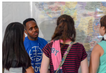
Die Arbeit der MKW kennenlernen.

Besuche den Markplatz, wo du all die Kulturen der weltweiten Täuferfamilie erfahren kannst. Lerne unsere Geschichte kennen, probiere unser Essen, sing und tanze mit, höre Geschichte, oder teile deine eigene Geschichte!