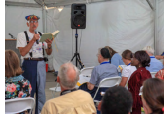
Besuche jeden Tag einen anderen Workshop.

Die Versammlung bietet Diskussionsmöglichkeiten über Themen von Frieden und Gerechtigkeit, Jugend, Sorge zur Schöpfung, Taufe, Interreligiöser Dialog, kreativer Dienst! Oder schlage ein weiteres Thema vor mwc-cmm.org/AssemblyWorkshop wenn du einen Workshop anbieten möchtest, in Person oder off-site.