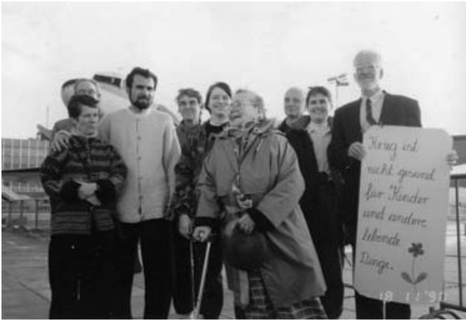
Eine Delegation der „Initiative Frieden am Golf“ am Flughafen Frankfurt vor der Abreise in den Irak im November 1990.