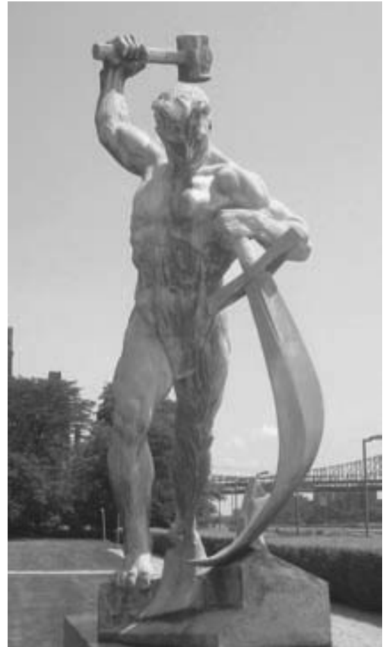
Schwerter zu Pflugscharen: Skulptur am Sitz der Vereinten Nationen, New York