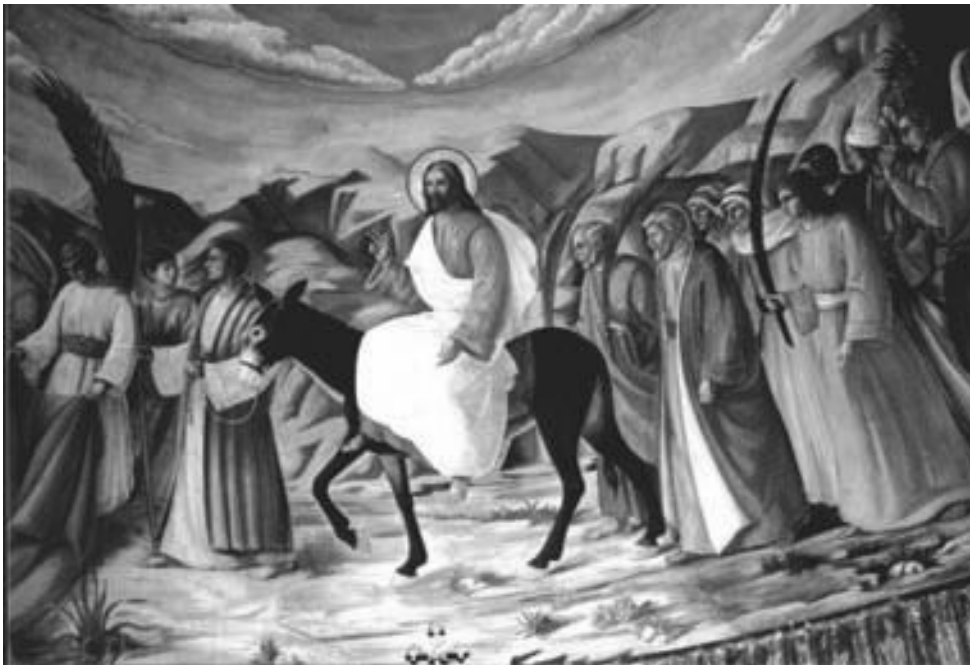
Jesus kommt nach Jerusalem

Er lebte unter uns Menschen als Bruder und Diener. 5 So wies er die Macht anderer Herren in ihre Schranken. Jesus Christus ist jedoch nicht nur der Herr seiner Gemeinde, er ist und bleibt Herr der Schöpfung und der Geschichte. Darum dürfen wir darauf vertrauen, dass sein Weg der Gewaltlosigkeit und der leidensbereiten Liebe uns ans Ziel führt.