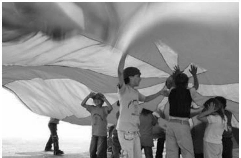
Palästinensische Kinder beim Friedenstanz